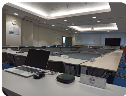
▲ ScribeAssist を利用している様子

実際に使ってみて最も驚いたのは、「AI要約の精度」です。これまでは「文字起こし→要約」という二段階が必要でしたが、「ScribeAssist」は多少の誤認識があっても文脈を理解して、質の高い要約議事録を瞬時に生成してくれます。