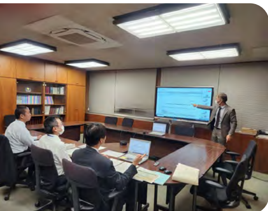
▲ ScribeAssist を利用している会議のイメージ