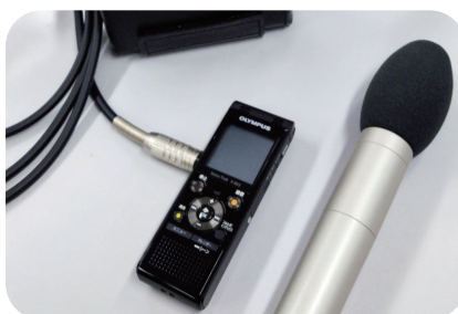
▲ 実際に使用しているハンドマイクとICレコーダー

としての機材を活用しています。ハンドマイクを使用し、マイクの音を無線で飛ばしてICレコーダーに接続することで、音声のクオリティを向上させ、文字起こし精度の向上に繋がっています。