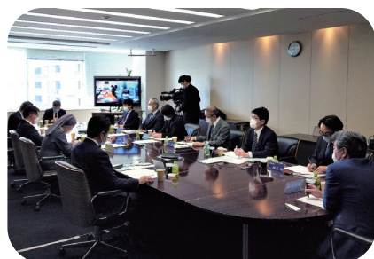
▲ 番組審議会の様子

番組審議会という、仙台市内の有識者の方々に番組について意見を聞くための会議を月に1回開催しています。これまでは外部の方に音声データを渡して文字起こしを依頼していたため、議事録の完成までに時間と手間がかかっていました。そんな中、音声認識技術の存在を知り、導入を検討開始しました。