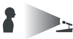
マイクと口元が遠いと×