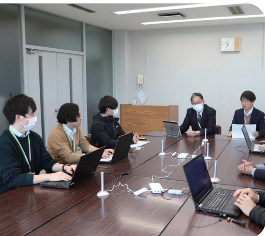
▲ ScribeAssist を活用している様子

「ScribeAssist」を活用することで、議事録の公開を迅速化することはもちろん、現在議事録を作成できていない会議についても議事録を作成できるようになります。これによって、より早く、より多くの情報を提供し、より開かれた行政を実現していきます。