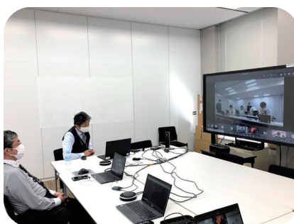
▲ ScribeAssist を利用している様子